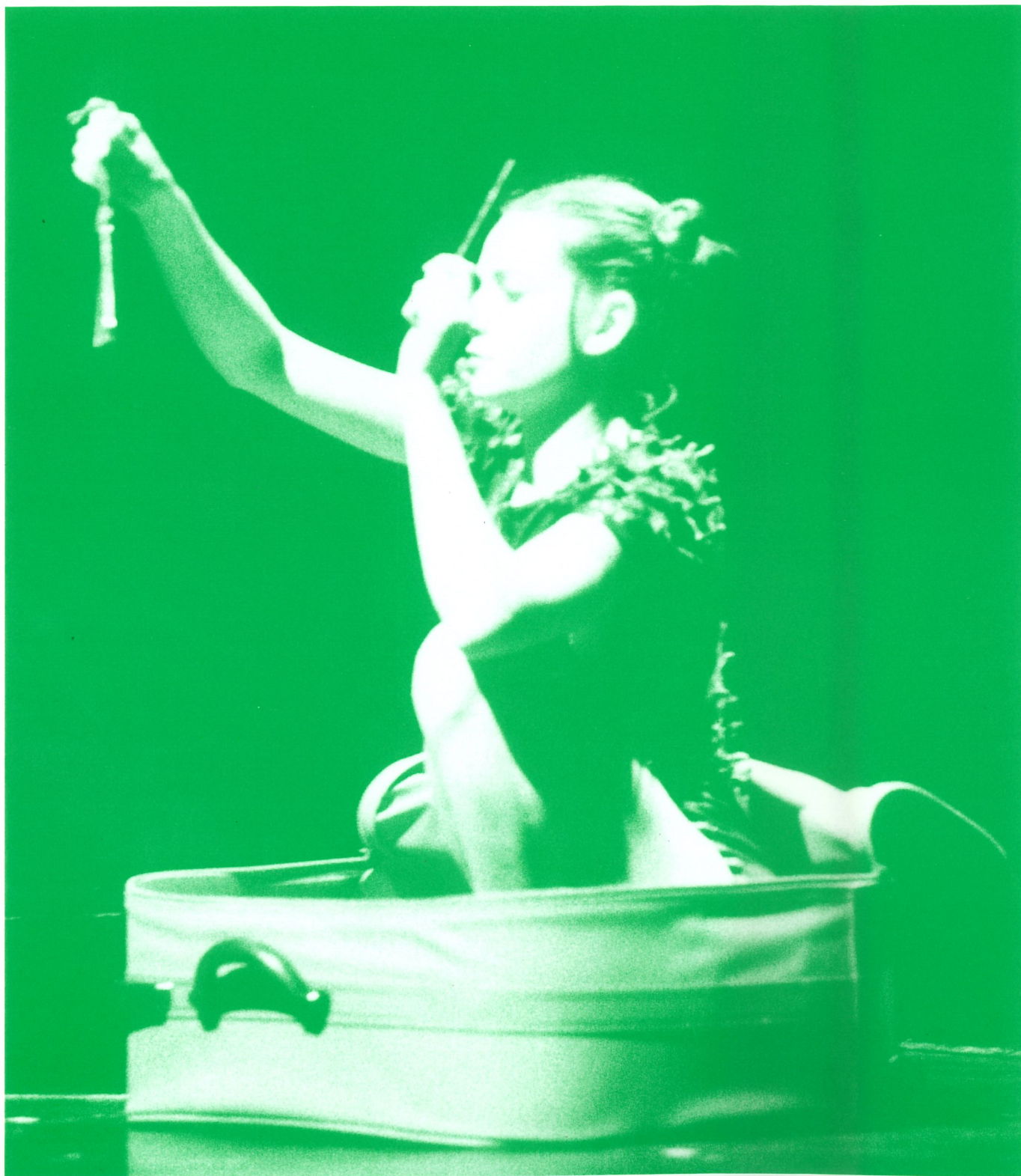
"TRITON 2 TER " DE PHILIPPE DECOUFLÉ, COMPAGNIE DCA GRANDE AUDITÓRIO, RIVOLI TEATRO MUNICIPAL, JANEIRO 2000