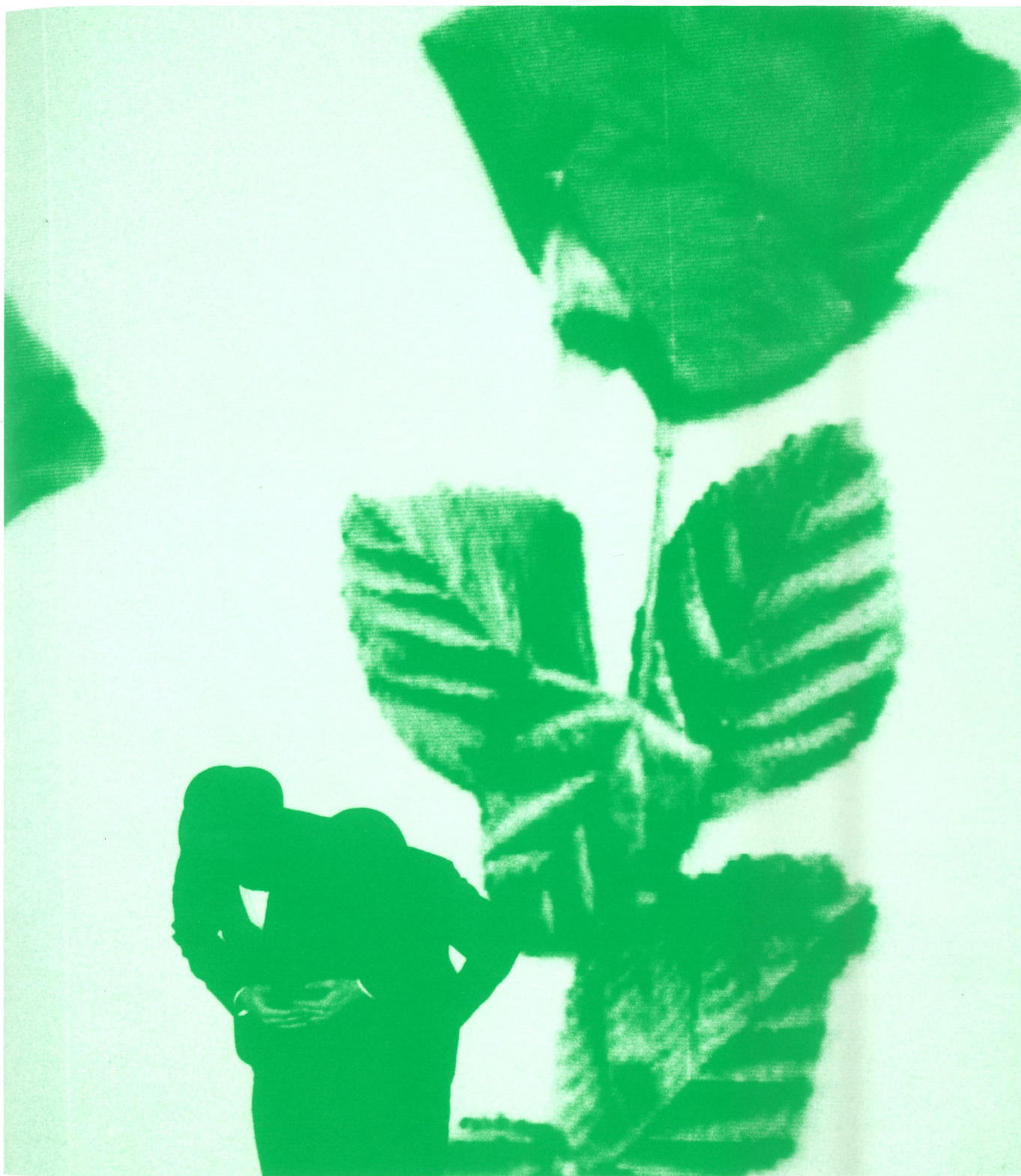
"L'ALTRO PROCESSO" - COMPAGNIA TEATRALE DI GIORGIO BARBERIO CORSETTI PEQUENO AUDITÓRIO, RIVOLI TEATRO MUNICIPAL, DEZEMBRO, PO.N.T.I. 1999