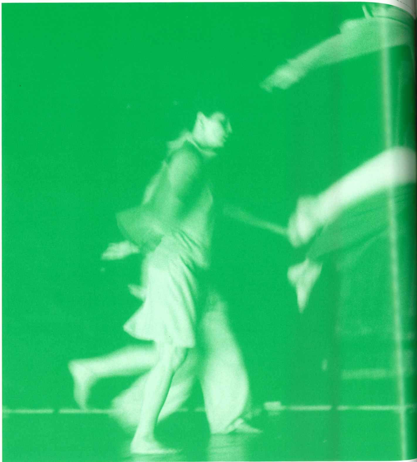
"I SAID I", DE ANNE TERESA DE KEERSMAEKER, COMPANHIA ROSAS GRANDE AUDITÓRIO, RIVOLI TEATRO MUNICIPAL, ABRIL 2001