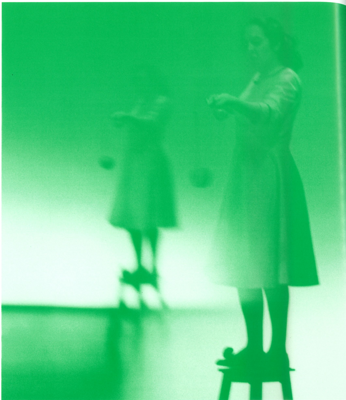
"AS FILHAS DO MARAJÁ" DE CARLOS J. PESSOA, TEATRO DA GARAGEM PALCO DO GRANDE AUDITÓRIO, RÍVOLI TEATRO MUNICIPAL, MAIO 2001