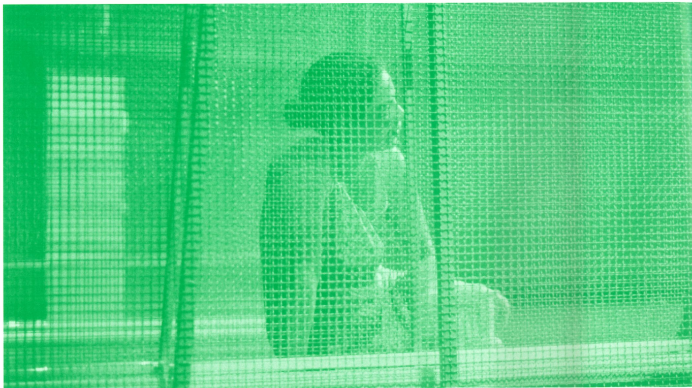
"(A)TENTADOS" DE MARTIN CRIMP, ENC. JOÃO PEDRO VAZ, ASSÉDIO GRANDE AUDITÓRIO, RIVOLI TEATRO MUNICIPAL, SETEMBRO 2002