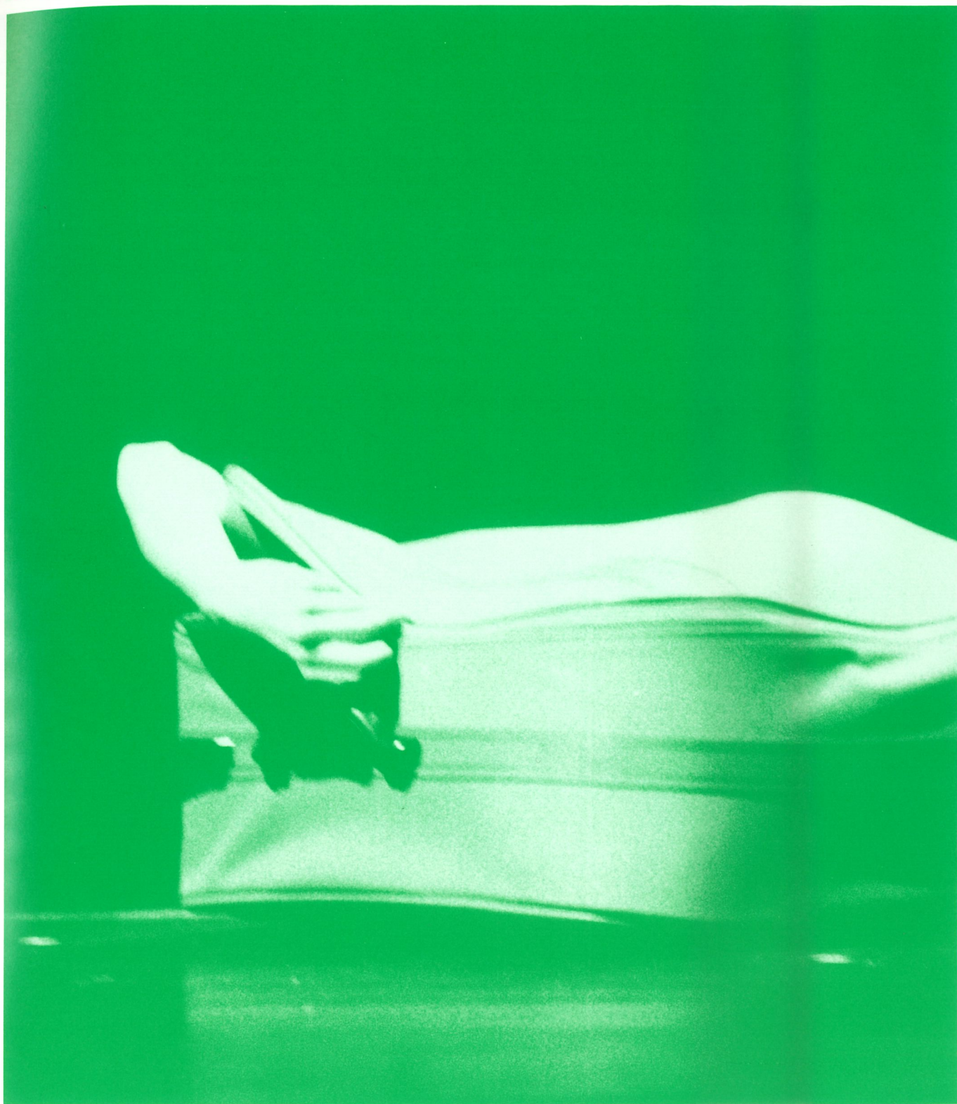
"TRITON 2 TER " DE PHILIPPE DECOUFLÉ, COMPAGNIE DCA GRANDE AUDITÓRIO, RIVOLI TEATRO MUNICIPAL, JANEIRO 2000